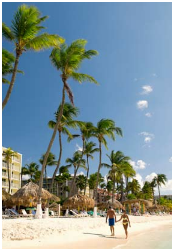
Van links naar rechts: Eagle Beach; Palm Beach; verkoper van vers kokoswater bij Lighthouse California. Rechterpagina: het zwembad van Paradera Park Apartments.