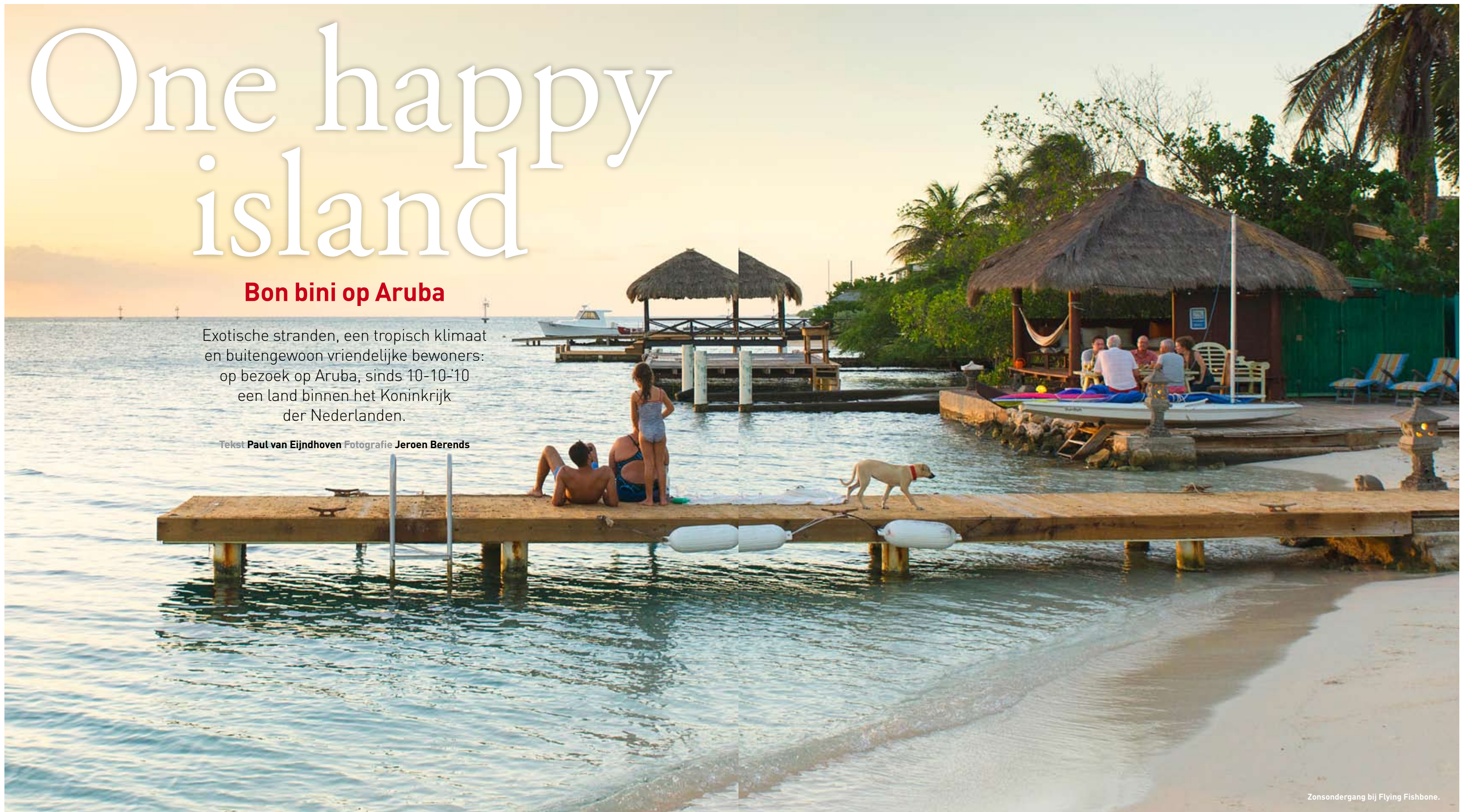
Zonsondergang bij Flying Fishbone.

Tekst Paul van Eijndhoven