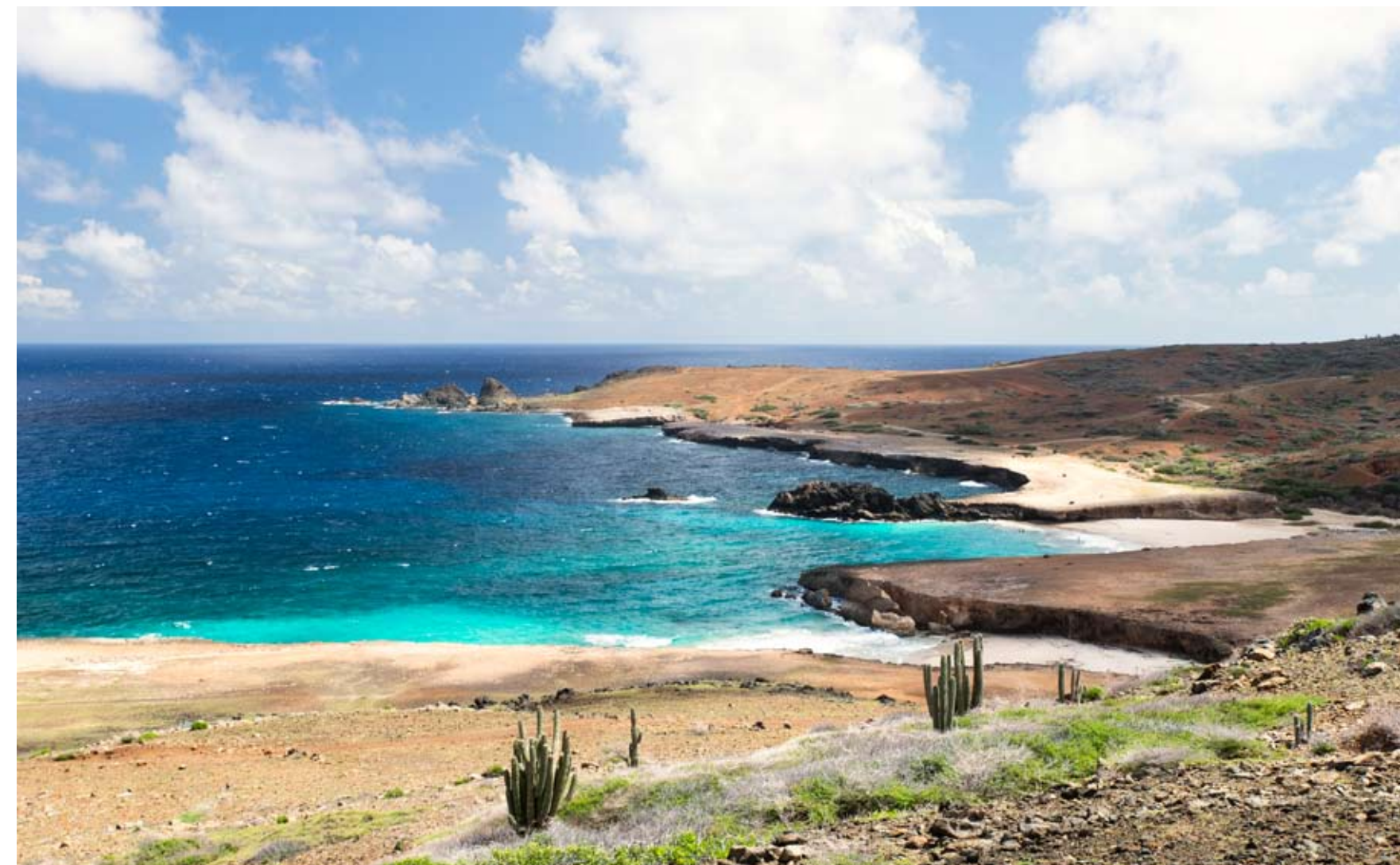
Boven: het ruige landschap van Noord-Aruba. Linkerpagina: de Donkey Sanctuary; terras van Flying Fishbone; Rodney 'oogst' een cactusvrucht in Arikok National Park; de Renaissance Mall in Oranjestad.

rustig oud te worden. Desirée Eldering runt deze opvang. 'Deze ezels waren wild en werden vaak slachtoffer van auto-ongelukken. Nu is er nog een klein groepje in het wild, maar die lopen door de plek waar ze zijn weinig gevaar.' Binnenkort gaat de sanctuary verhuizen naar een veel groter terrein elders op het eiland, de dieren hebben nu eigenlijk wat weinig ruimte. Als we een zakje voer krijgen komen de ezels snel onze kant op. Desirée kent ze allemaal bij naam. 'Die bruine daar aan het eind is Chocolate, dat is het alfamannetje.' We lunchen bij The Old Cunucu House, in een ruim 150 jaar oude boerderij. In deze mooie omgeving staan wat traditionelere Arubaanse gerechten op de kaart, zoals geitenstoofpot, maar ook een uitstekende red snapper. 's Middags staat een bezoek aan Aruba Aloe op het programma, een bedrijf dat al sinds 1890 aloë kweekt en er producten van maakt. De kordate Veronique legt eerst uit hoe de bladeren verwerkt worden. Zo werd vroeger het donkere sap dat uit een blad stroomt direct nadat het is afgesneden als laxeermiddel