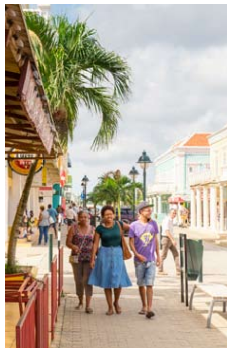
Openingspagina's: strandje bij '1000 steps'. Deze pagina, links: leguaan; Kaya Grandi, de winkelstraat van Kralendijk; onder: terras van Hang Out Beachbar aan het Lac; leguaan bij '1000 steps'. Rechterpagina: Washington Slagbaai National Park.

H et mag nauwelijks verbazen: het luchthavengebouw van Flamingo Airport is roze. Vanaf Curaçao hebben we er vijftien minuten over gedaan om op dit piepkleine vliegveld van Bonaire – met één landingsbaan – aan te komen. Heel overzichtelijk, in no time hebben we onze bagage en