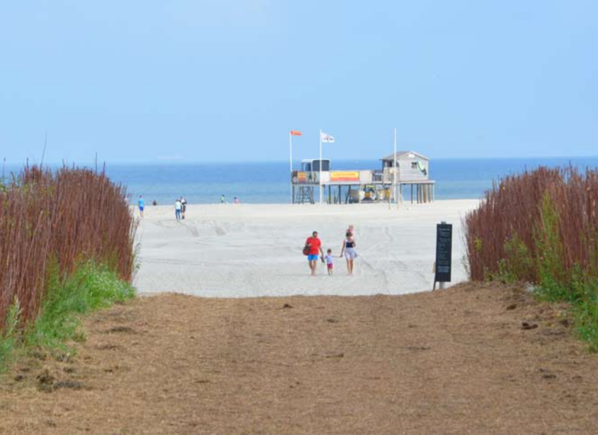
Boven: het strand bij badpaviljoen De Marlijn; onder: muziek maken op het wad in afwachting van hoogtij.