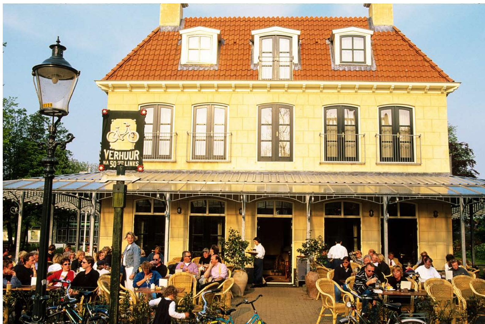
Het terras van Hotel Graaf Bernstorff.

waar kitesurfers hun kunsten laten zien. Midden op het strand staat een strandtent op palen, waar een leuke, wat alternatieve sfeer hangt. Het is goed om te zien dat er nog wat andere sportieve activiteiten op het eiland zijn, naast het wat bedaarde wandelen en fietsen. Na een lunch in het dorp moet ik natuurlijk ook de zuid- en westkant van het eiland verkennen. Het is laagtij, dus de Waddenzee staat grotendeels droog. In de verte zie ik wat wadlopers. Dichterbij struinen hoogpotige vogels parmantig over de drooggevallen grond, op zoek naar voedsel. Vogels zijn er in vele soorten en maten op Schier, dus de vogelaar kan hier zijn hart ophalen. Een van de verzamel-