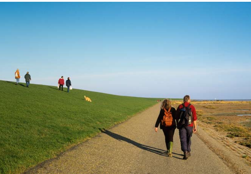
Met de klok mee: sporen van de wind zijn overal; de daken van de huisjes zijn zo gebouwd dat ze zo min mogelijk last hebben van de bijna altijd aanwezige wind; nieuwsgierige schapen; buitendijks wandelen aan de Waddenzeekant van het eiland.