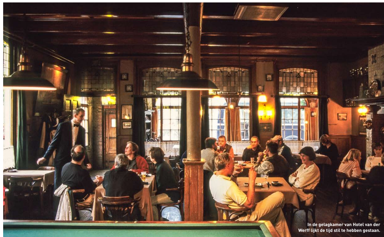
In de gelagkamer van Hotel van der Werff lijkt de tijd stil te hebben gestaan.