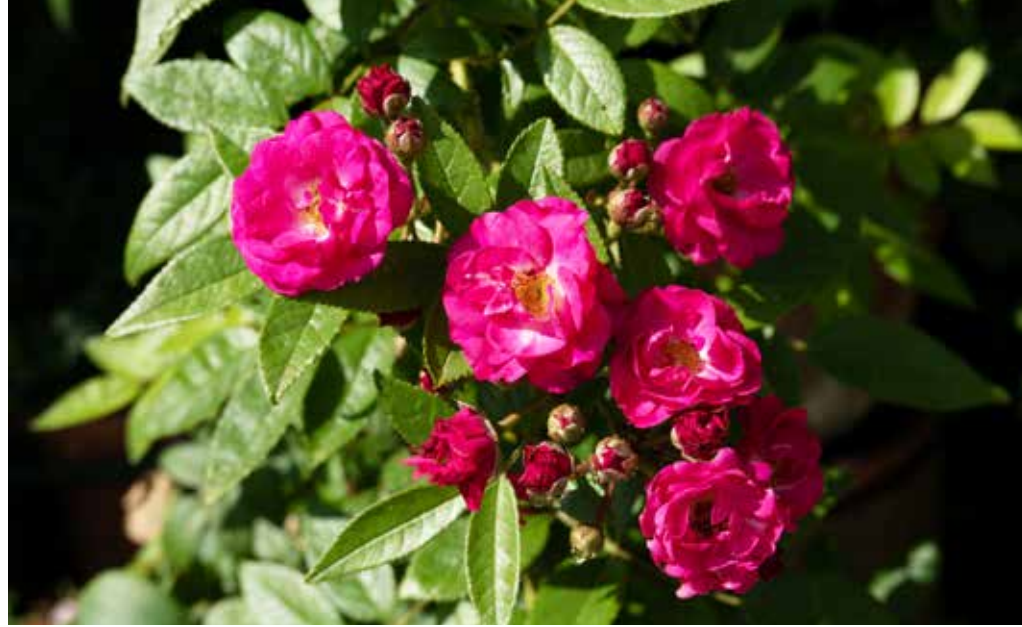
In de tuinen van Villa Durazzo Pallavicini.