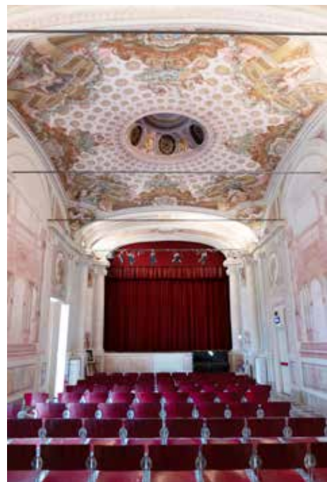
Met de klok mee: uitzicht op Voltri; de reeën in het park van de Villa Duchessa di Galliera; het bijzondere theater in de villa.