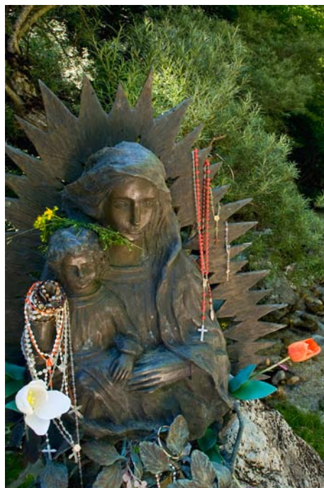
Boven: de Monti Sibillini; onder: beeltenis van de Madonna dell'Ambro, behangen met rozenkransen. Na een verschijning van de Heilige Maagd kreeg een doofstom meisje hier rond het jaar 1000 haar spraak terug.

Behendig zwaaien ze de vaandels, gooien ze in de lucht en weten ze weer feilloos op te vangen. Op dit fraaie plein een spectaculair gezicht