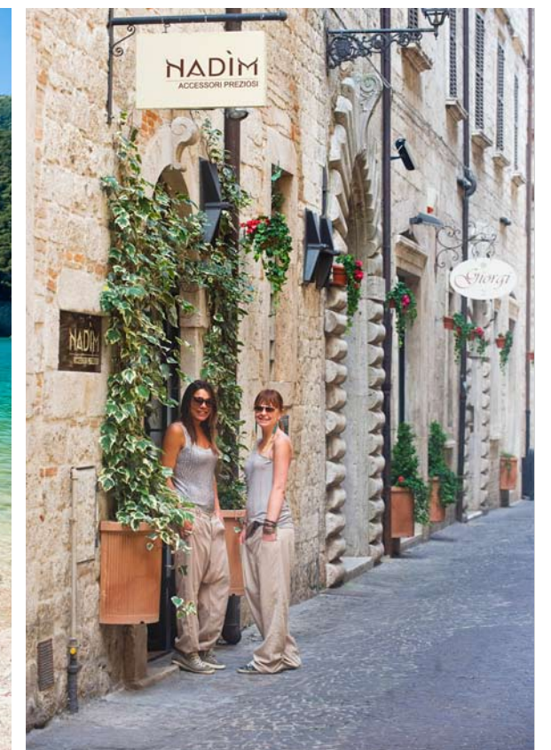
Linkerpagina: uitzicht op de Monti Sibillini; Ascoli Piceno. Deze pagina: de Piazza del Popolo in Ascoli Piceno; vissen in het Lago di Fiastra; tassenwinkel Nadim in Ascoli Piceno.