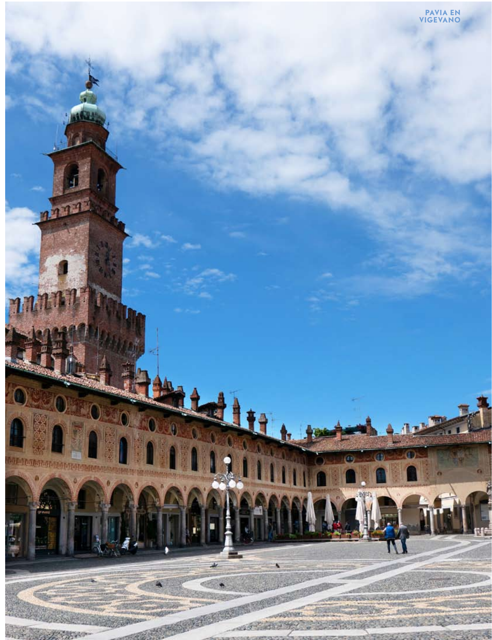
Terras op de Piazza Ducale; gedenkteken voor een alpinist in de Duomo; de voormalige stallen van het kasteel; slipper van Beatrice d'Este in het schoenenmuseum. Rechterpagina: Piazza Ducale in Vigevano met de Torre del Bramante.

'modelboerderij' Sforzesca - even buiten Vigevano - met zijn netwerk van kanalen en watermolens doen sterk denken aan Da Vinci's ontwerpen voor de ideale stad. Onder Ludovico II Moro en zijn vrouw Beatrice d'Este werd de indrukwekkende Torre del Bramante de officiële entree van het Castello Sforzesca. In en rond het kasteel zijn diverse bezienswaardigheden, zoals de Falconiera, de loggia van de valkeniers, de Loggia delle Dame, de scuderie , die erg lijken op de 'modelstal' van Da Vinci en diverse musea. Uniek is het schoenenmuseum in het kasteel, het enige in zijn soort in Italië, gewijd aan de geschiedenis en de ontwikkeling van de schoen en aan bijzondere ontwerpen. Geen toeval dat het hier is, want Vigevano heeft een eeuwenlange schoenmakertraditie. Een hoogtepunt in de collectie is een slipper gevonden in het kasteel. Heeft Beatrice d'Este deze gedragen?