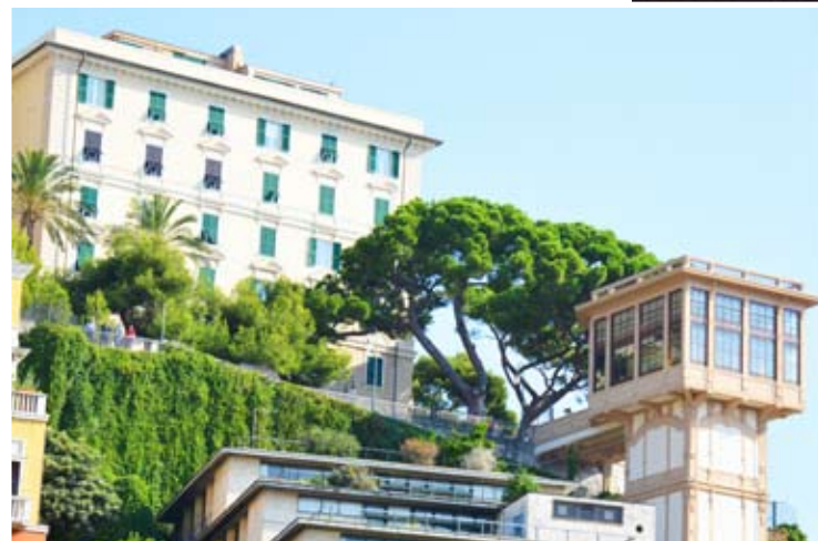
Linkerpagina, met de klok mee: de Porto Antico; uitzicht over de stad; een van de vele liften in de stad die tegen heuvels gebouwd zijn; Palazzo Lomellino, een van de Palazzi dei Rolli. Deze pagina: dansen op de Piazza De Ferrari.

Maar liefst 42 van de nog resterende negentig stadspaleizen vallen hieronder. We zijn in Genua tijdens de Rolli Days, een initiatief waarbij driemaal per jaar een weekend lang een aantal Palazzi dei Rolli zijn deuren opent voor dansuitvoeringen, muziek of kunstinstallaties en performances. Daarnaast zijn enkele palazzi dit weekend gratis te bezoeken.