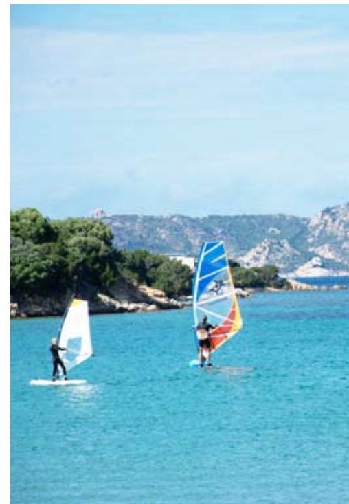
Terras bij Capo Testa; de haven van Porto Rotondo; in het dorpje Aggius; surfen bij Porto Pollo.

Een uurtje later kom ik bij het beroemde Porto Cervo, de speeltuin van de rich & famous . Het dorp ligt prachtig aan een baai met helblauw water. Niet voor niets heet dit stukje kust de Costa Smeralda, de smaragd kust. Echte inwoners heeft >