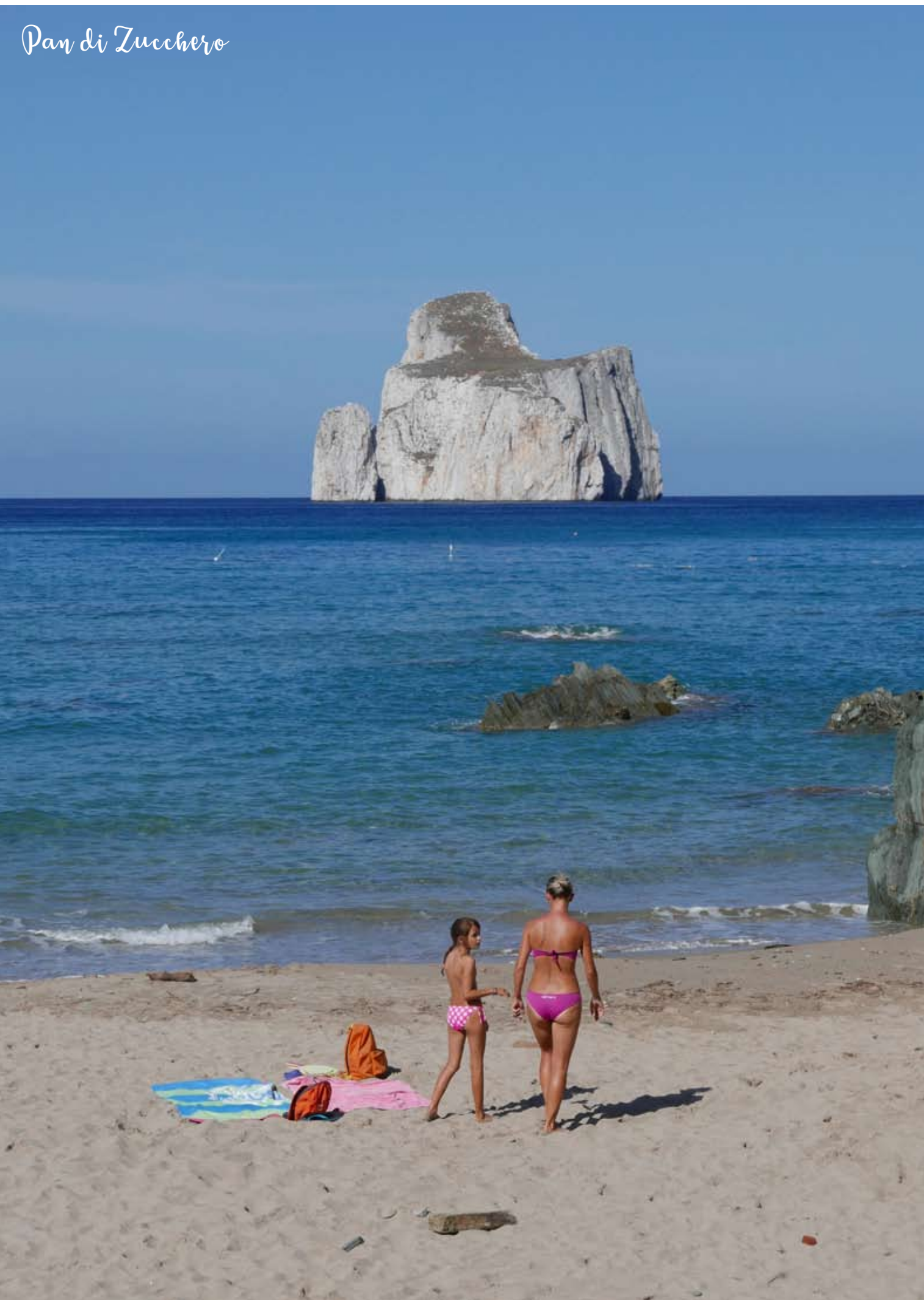
Pan di Zucchero