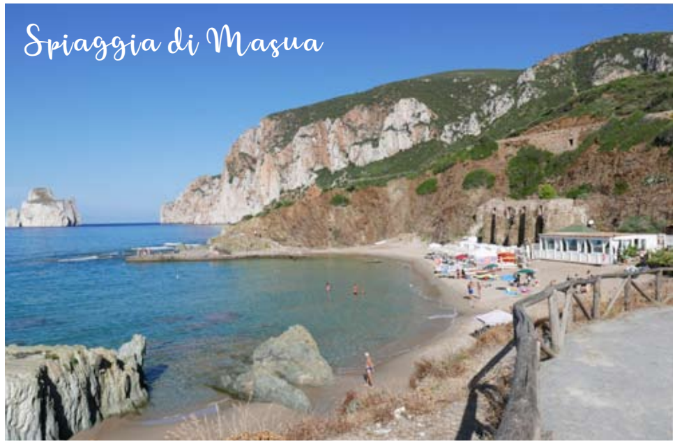
Spiaggia di Masua