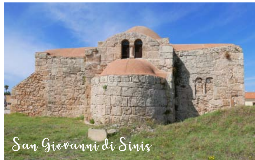
San Giovanni di Sinis

met diverse restaurants en bars. Na enkele honderden meters komt de trekker van dit dorp in zicht, een steenen boog die eveneens S'Archittu heet. Van de zijkanten van de boog springen jonge durfals de zee in. De strandjes onder aan de rotsen zijn smal, maar liggen mooi beschermd.