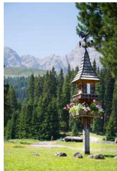
Zicht op Ortisei; Alpe si Siusi.

Als we later in de middag weer terug zijn in het hotel voel ik duidelijk aan mijn benen dat zij ook bij e-biken nog het nodige moeten doen. Tijdens het diner wordt er al druk gespeculeerd over de volgende dag als we de Sellaronda zullen gaan fietsen. Op de Sellaronda Bike Day worden de wegen rondom het massief voor auto's afgesloten zodat de fietsers alle ruimte hebben. Maar de weersverwachting is niet best en later op de