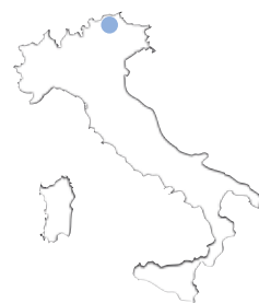
De Sellaronda Bike Day. Rechterpagina: Diverse plekken rond Selva; proeverij van grappa's in Maso Paratoni.

van een dalletje waar een wandelpad zich door het groen slingert richting een bergwand. De velden staan in bloei en om beurten laten we ons in het gras vallen voor wat melige foto's. Na een glas Hugo, hét Zuid-Tiroler aperitief van vlierbloesemsiroop en prosecco, genieten we van een heerlijke lichte lunch. Daarna is er tijd voor ontspanning, dus ik wandel wat door het dorp, begeef me naar het zwembad van het hotel, waar je van binnen naar buiten kunt zwemmen wat ik toch elke keer weer bijzonder vind. Tijdens de aperitivo worden we al een beetje warm gestoomd voor het mountainbiken van de volgende dag, in dit geval e-mountainbiken. Bosch is sponsor voor wat betreft het e-gedeelte, daarnaast worden we allemaal voorzien van een felgroene Endura Luminite-fietshelm. Daarna eten we met de hele groep van Scandinavische, Britse en Nederlandse journalisten in het hotel. Altijd weer leuk om gedachten te wisselen met vakgenoten uit naburige landen.