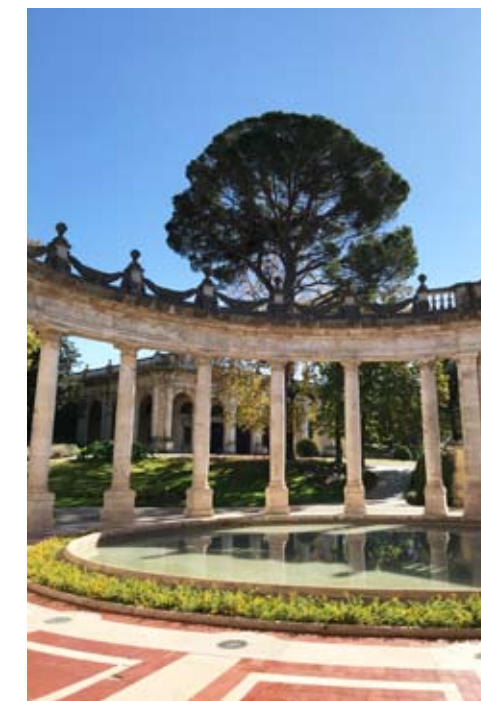
Langs de weg van Cortona naar Pistoia; Terme Tettuccio in Montecatini Terme; Chiesa del Tau met werk van Marino Marini in Pistoia.