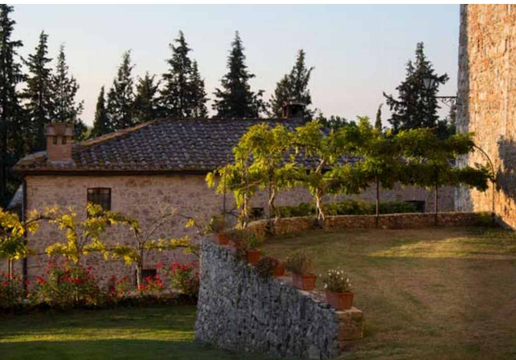
Piazza Grande in Arezzo; de tuin van Castel Pietraio.

hier ooit gelogeed op het kasteel vanwege een huwelijk in de buurt. Heel aardig, heel normaal. Wel waren er heel de tijd drie man security bij.'