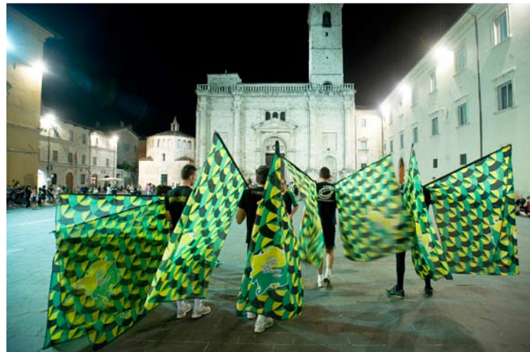
Sfeerimpressies van het strand in San Benedetto del Tronto en van dorpen in de provincie Ascoli Piceno. Linksonder: vendelzwaaiers oefenen op de Piazza Arringo in Ascoli Piceno voor hun traditionele vendelzwaai-battle.