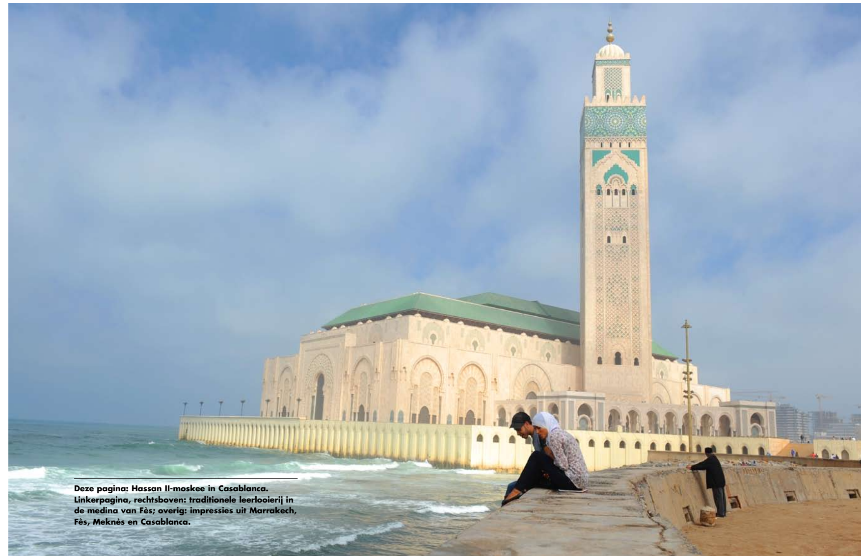
Deze pagina: Hassan II-moskee in Casablanca. Linkerpagina, rechtsboven: traditionele leerlooierij in de medina van Fès; overig: impressies uit Marrakech, Fès, Meknès en Casablanca.

Van kasten tot lampen en wandversieringen: je kijkt je ogen uit in deze fantastische interieurzaak in Marrakech. Vele malen groter dan je op het eerste gezicht denkt. 142, 144 Bab Doukkala, Marrakech.