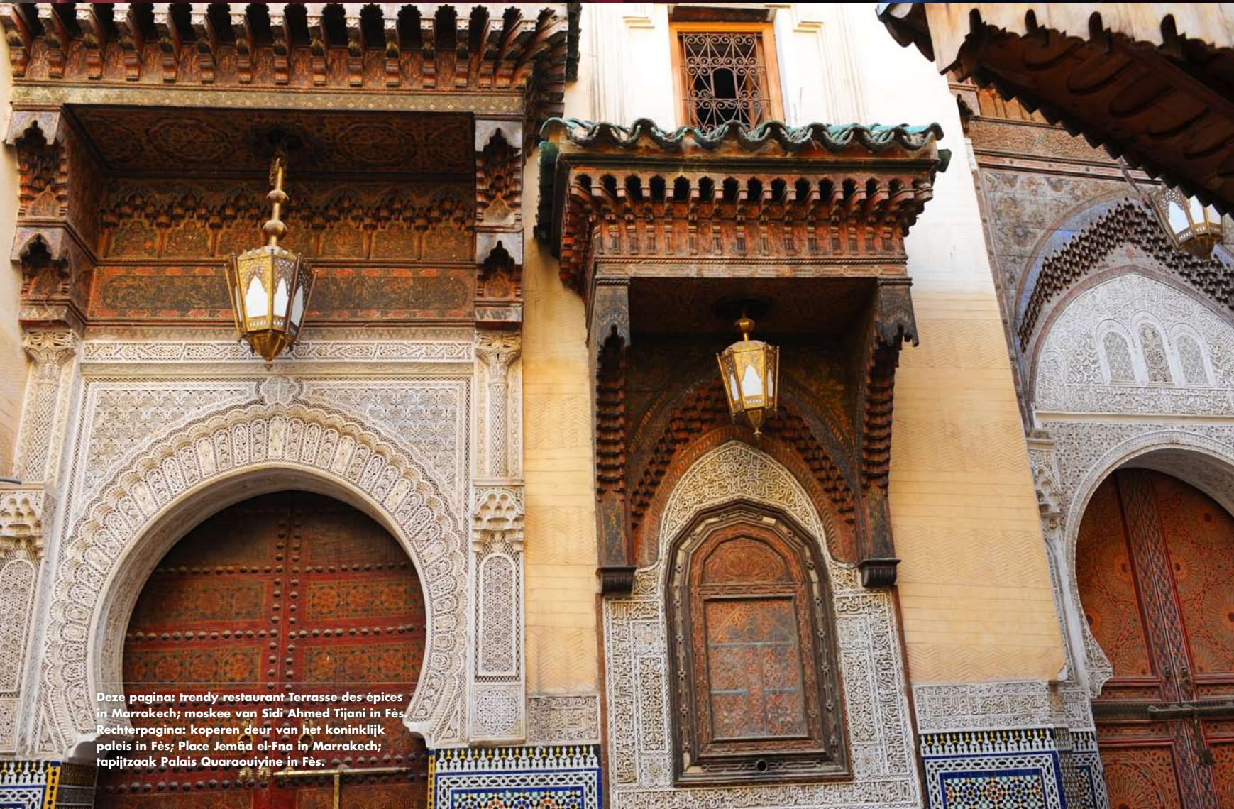
Deze pagina: trendy restaurant Terrasse des épices in Marrakech; moskee van Sidi Ahmed Tijani in Fès. Rechterpagina: koperen deur van het koninklijk paleis in Fès; Place Jemâa el-Fna in Marrakech; tapijtzak Palais Quaraouiyine in Fès.

Redelijk uitgeput bereiken we Marrakech. Twee etappes voor deze rit was een beter idee geweest eigenlijk. Desondanks begeven we ons naar het Jemâa el-Fna-plein. Overdag is hier een markt, maar 's avonds ontstaat er een waar openluchtsppektakel. Het halve plein is gevuld met eettentjes, waar zowel toeristen als Marokkanen zich op lange banken tegoed doen aan onder meer vers geroosterd vlees. Het is een drukte van belang en er hangt een gezellige sfeer. Dit stond nog op ons lijstje van must sees. Met een gerust hart kan nu dus de terugtocht worden aanvaard, zij het met spijt dat we niet nog wat meer tijd hebben voor Marrakech. Een goede reden om nog eens terug te komen. • >